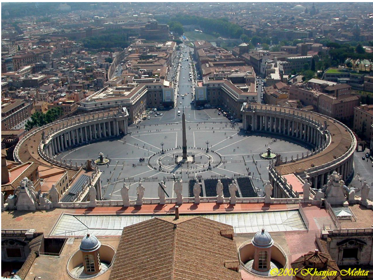
Hình 2: Vatican City