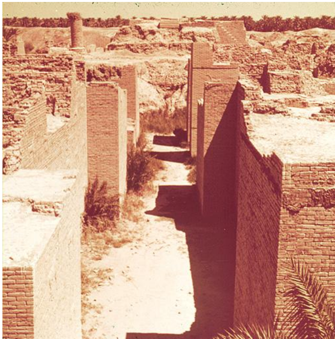
Hình 1: Di tích cổng Ishtar của cổ thành Ba-by-lôn

Thành phố Ba-by-lôn, được đề cập trong Thánh Kinh, nằm trên một vùng đất cách thủ đô Baghdad của Iraq khoảng 90km về phía Nam. Trong lịch sử nhân loại, nó là thành phố quan trọng thứ nhì, chỉ đứng sau Giê-ru-sa-lem. Theo Thánh Kinh, Ba-by-lôn là thủ phủ của đế quốc đầu tiên của loài người (Sáng Thế Ký 10:10). Đó cũng là nơi có tháp Ba-bêl, là công trình đầu tiên của loài người, thể hiện tinh thần hiệp một chống nghịch Đức Chúa Trời. Bởi biến cố đó mà Đức Chúa Trời đã làm lộn xộn ngôn ngữ của loài người và phân tán họ đi khắp đất (Sáng Thế Ký 11). Trong hành trình phân tán đó, loài người đem tư tưởng chống nghịch Đức Chúa Trời, thờ lạy thần tượng gieo rắc khắp nơi. Chúng ta gọi sự chống nghịch Đức Chúa Trời đó là tinh thần Ba-by-lôn . Tinh thần Ba-by-lôn thể hiện trong văn hoá, phong tục, và tôn giáo của loài người. Thành phố Ba-by-lôn vì vậy được xem là hang ổ và là cái nôi của sự chống nghịch Đức Chúa Trời, thờ lạy hình tượng. Sau này, nó trở thành thủ phủ của đế quốc Ba-by-lôn, vào thế kỷ thứ 6 TCN, đã đánh chiếm, hủy diệt Giê-ru-sa-lem và bắt dân Y-sơ-ra-ên lưu đày trong 70 năm. Sự việc Giê-ru-sa-lem thất thủ vào tay đế quốc Ba-by-lôn và dân sự bị lưu đày qua Ba-by-lôn được các đầy tớ Chúa là Ê-sai và Giê-rê-mi tiên tri từ trước.