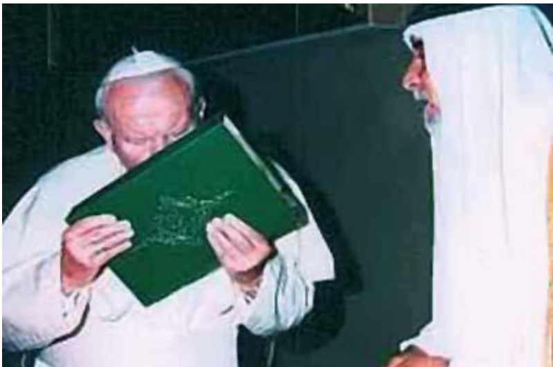
Hình 5: Giáo hoàng John Paul II hôn cuốn kinh Qu'ran