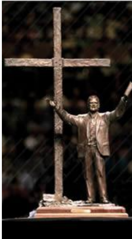
Hình 4: Tượng của Billy Graham được Giáo Hội Báp-tít Nam Phương xây và đặt tại Nashville. Điều khắc gia là một mục sư tại Wyoming, Hoa Kỳ. Trong buổi khánh thành tượng có con trai của Billy Graham là Franklin Graham thay mặt ông tới dự.

Ngoài ra, Billy Graham còn tán thành việc xây tượng cho mình [9], bỏ quên đi điều răn của Đức Chúa Trời sau đây: